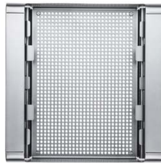
Mini Monolite Tray 60