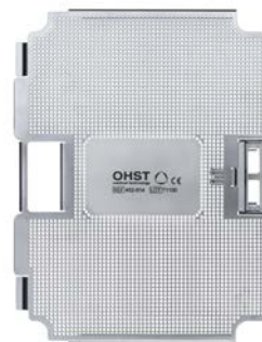
Deckel für Mini Monolite Tray 60