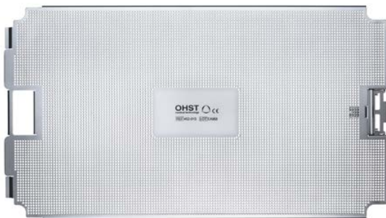
Deckel für Monolite Tray 110