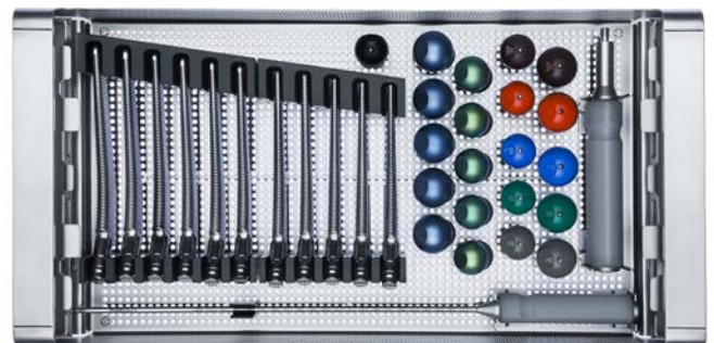
Raspelinstrumentarium Müller Geradschaft