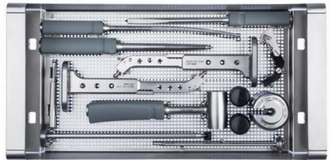
Grundinstrumentarium Expersus Hüftschafte

Beide Instrumenten Sets können in unseren Monolite Trays ausgeliefert werden. Die Instrumentenwannen sind in einem Stück aus hochwertigem Edelstahl gefertigt. Das System zeichnet sich durch ein geringes Gewicht aus und lässt sich beliebig stapeln.